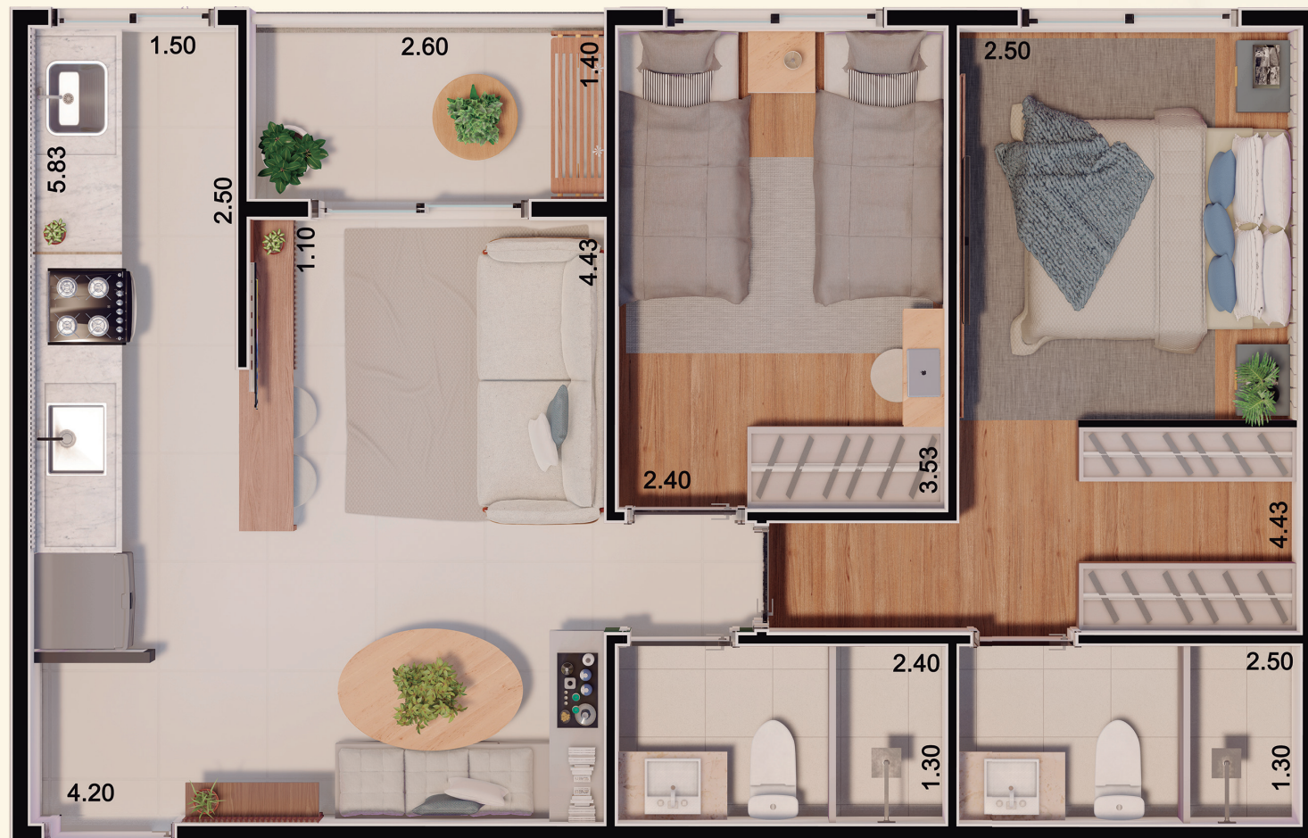
Planta referente aos apartamentos finais 04 e 06