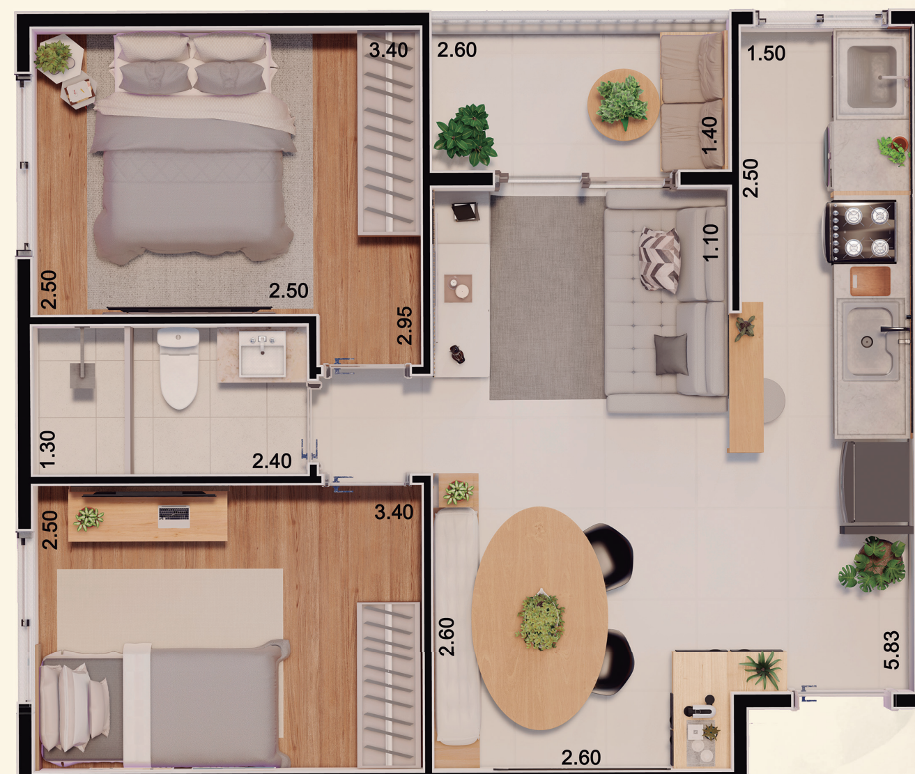
Planta referente ao apartamento final 02